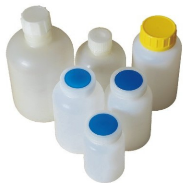
250cc ~ 1000cc 各類塑膠容器