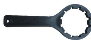
鎖 / 開蓋把手